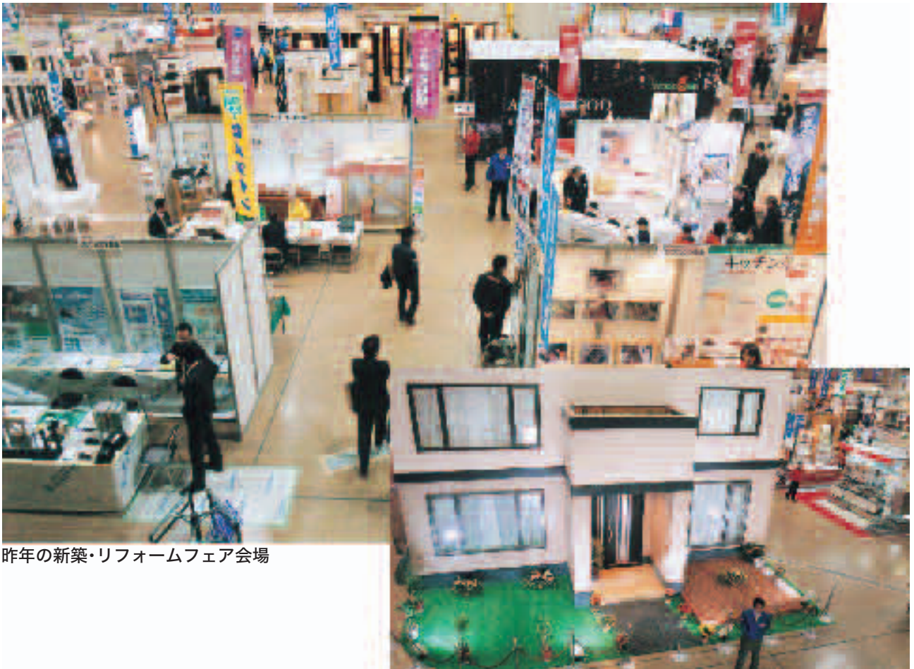
昨年の新築・リフォームフェア会場

2月23日(金)～2月25日(日) 10:00～17:00(最終日は16:00まで) 入場無料